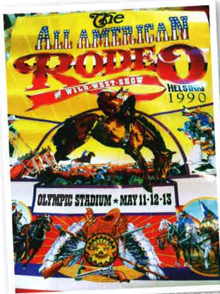
Helsingin olympiastadionilla vierailut All American Rodeo toi lännenratsastuksen Suomeen vuonna 1990.